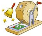
木工製品が当たる 抽選会も実施します