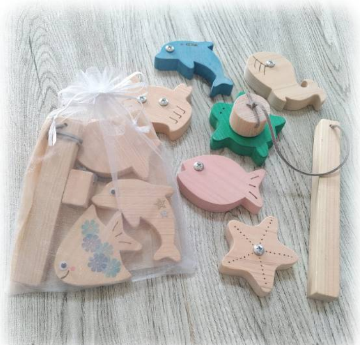
ワークショップ体験を開催されるブースもあります！ ※内容は変更になる場合があります。