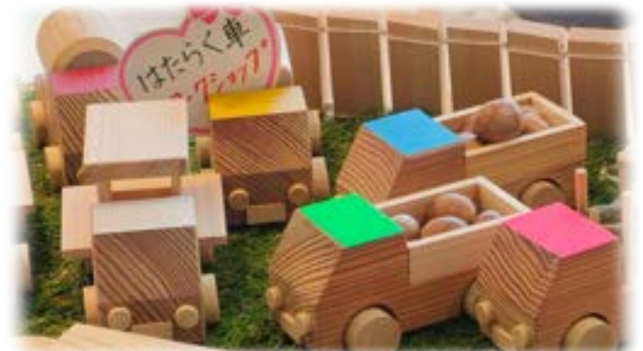
可愛いおもちゃや、おしゃれな雑貨が揃ってます！