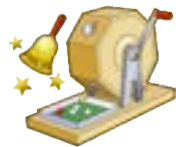
木工製品が当たる 抽選会も実施します