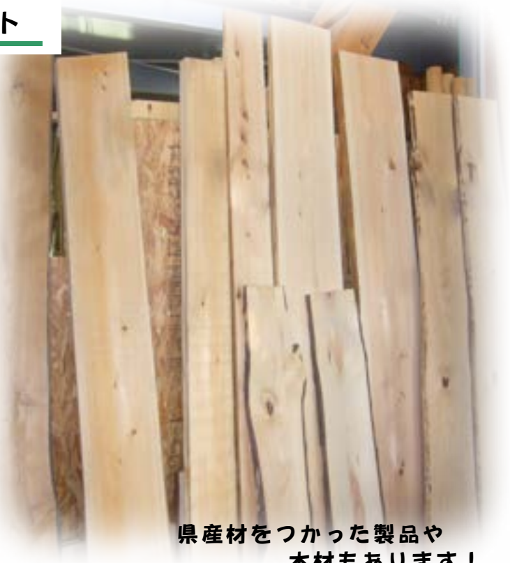
県産材をつかった製品や 木材もあります！